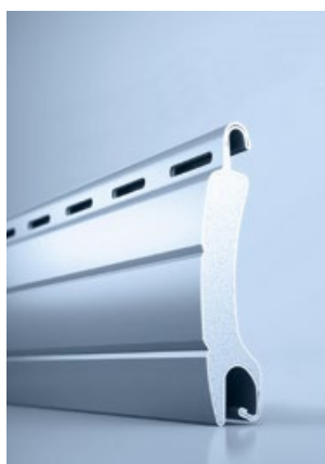
1 heroal RS 32