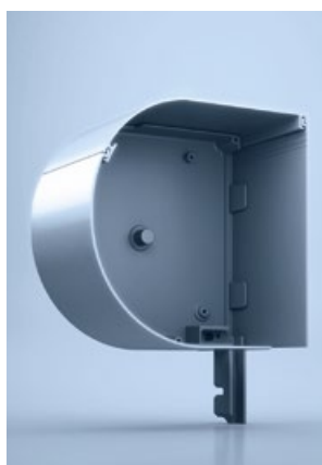
3 heroal FME HC