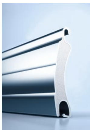
2 heroal RS 37 RC 3