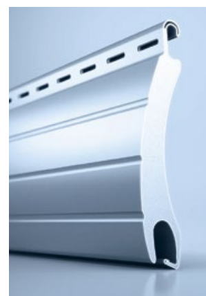
4 heroal RS 55 SL