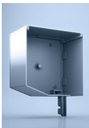
2 heroal FME 20°