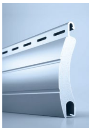
3 heroal RS 42