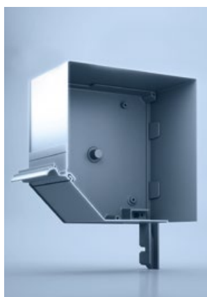
1 heroal FMB 45°

De kwartronde gerolvormde kast heroal FMR Q is de perfecte voorbouwvariant voor de montage in diepe neggen: de bovenzijde van het kaststelsel sluit vlak aan onder de latei – een kastoplossing die zowel elegant als subtiel is.