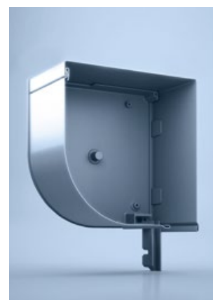
4 heroal FMR Q